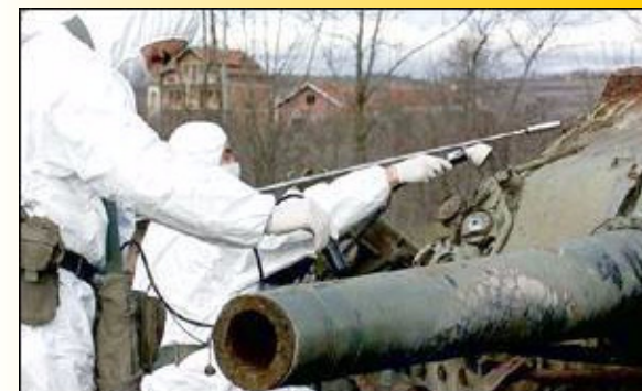
Une inspection radiologique d'un char de combat au Kosovo

Armes à l'URANIUM APPAUVRI - un danger à long terme pour homme et environnement