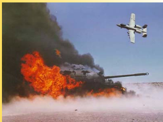
Un avion A-10 décharge des projectiles à l'UA.

kilomètres de leur origine et peuvent s'envoler de nouveau des années plus tard.