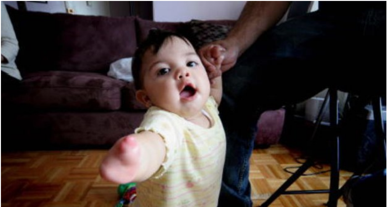
Victoria werd geboren zonder vingers aan de rechterhand. Haar vader werd besmet door verarmd uranium tijdens de Irakoorlog van 2003.

Belgische Coalitie 'Stop Uraniumwapens!'