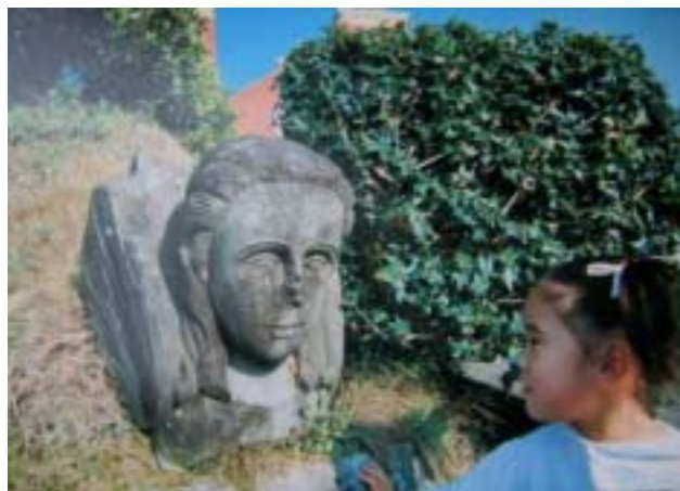
L'ange endommagé de la cathédrale. Symbole du mouvement anti-armement nucléaire.

Cette exposition de qualité a été montrée pour la première fois au Lakenhalle de la Ville d'Ypres, en présence d'une quarantaine de bourgmestres ayant souscrit à l'appel du bourgmestre de Hiroshima le 6 août 2004. Dans la continuité du 60ème anniversaire des bombardements, l'exposition a été accueillie à la Maison communale de Roeselare, la Vredhuis de Gand, la bibliothèque de Louvain ainsi que la Cathédrale de Peer.