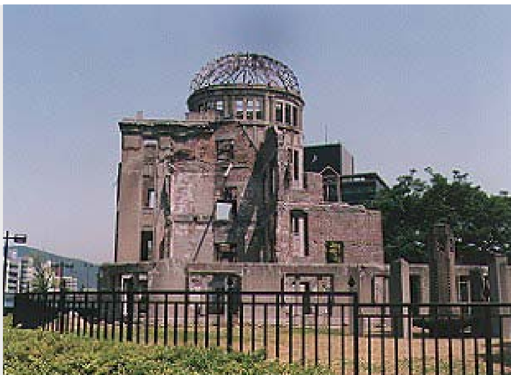
Photo de la Bombe A Dôme à Hiroshima

Le Conseil des jeunes peut, en collaboration avec les autorités communales, décider d'envoyer un certain nombre de jeunes à Nagasaki et Hiroshima pour les commémorations annuelles le 6 et le 9 août. Une idée concevable pour l'échange de jeunes.