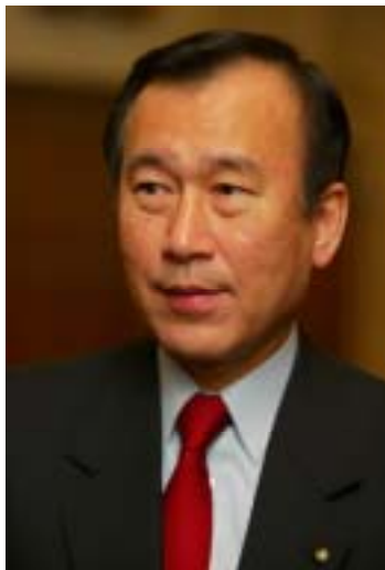
Tadatoshi Akiba, bourgmestre de Hiroshima – président Mayors for Peace

It is a great honor to write a foreword for this anti-nuclear campaign kit developed by the volunteers of For Mother Earth (FME), in close cooperation with the peace town of Ypres. FME and Ypres have been a remarkable force in Europe supporting Mayors for Peace and the 2020 Vision Campaign. Working closely with other NGOs, Parliamentarians and Mayors, they have succeeded in bringing nearly half of Belgium's mayors into Mayors for Peace. As of January 2006, Belgium has the largest Mayors for Peace contingent in the world. In addition, the FME alliance was instrumental in persuading the European and Belgian parliaments to endorse the 2020 Vision. The latter even called for removal of U.S. nuclear weapons from Europe.