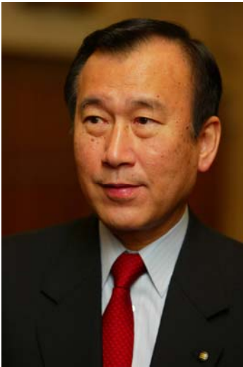
Tadatoshi Akiba, burgemeester van Hiroshima - voorzitter Mayors for Peace

It is a great honor to write a foreword for this anti-nuclear campaign kit developed by the volunteers of For Mother Earth (FME), in close cooperation with the peace town of Ypres. FME and Ypres have been a remarkable force in Europe supporting Mayors for Peace and the 2020 Vision Campaign. Working closely with other NGOs, Parliamentarians and Mayors, they have succeeded in bringing nearly half of Belgium's mayors into Mayors for Peace. As of January 2006, Belgium has the largest Mayors for Peace contingent in the world. In addition, the FME alliance was instrumental in persuading the European and Belgian parliaments to endorse the 2020 Vision. The latter even called for removal of U.S. nuclear weapons from Europe.