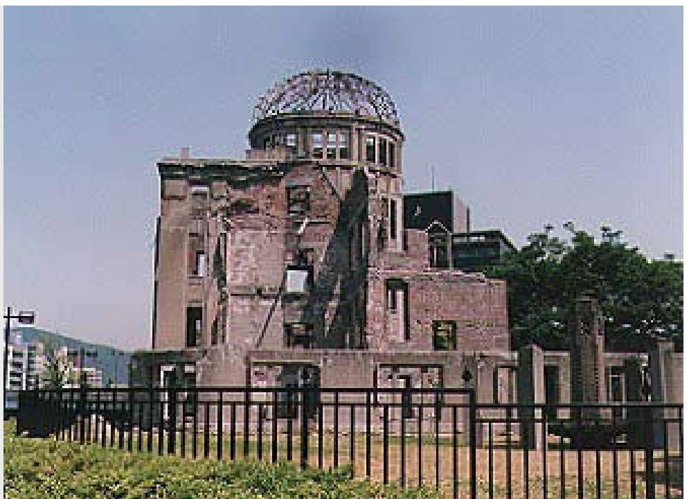
Foto van de A-bomb Dome in Hiroshima