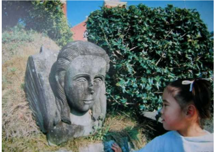
De beschadigde engel van de kathedraal. Symbool van de anti kernwapenbeweging.

Deze kwaliteitsvolle tentoonstelling werd voor het eerst vertoond in de Lakenhalle van de Stad Ieper in aanwezigheid van een veertigtal burgemeesters die de noodoproep van de burgemeester van Hiroshima onderschreven op 6 augustus 2004. Naar aanleiding van de 60 ste verjaardag van de atoombombardementen werd in 2005 deze tentoonstelling georganiseerd in het Stadhuis van Roeselare, het Vredeshuis van Gent, de bibliotheek van Leuven en de hoofdkerk te Peer.