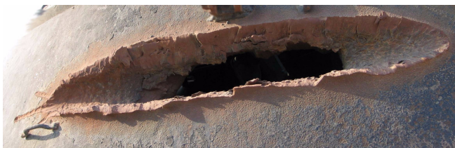
Een DU-projectiel scherpt zichzelf aan bij het inslaan op een metalen pantserplaat.

Deze studie stelde vast dat gemiddeld 79 % van de in de lucht gebrachte DU-deeltjes - gemeten in de windrichting van een getroffen voertuig - van inadembare grootte zijn (minder dan 10 micrometer groot) zodat bij inademing ze zich blijvend in de longen kunnen vastzetten.