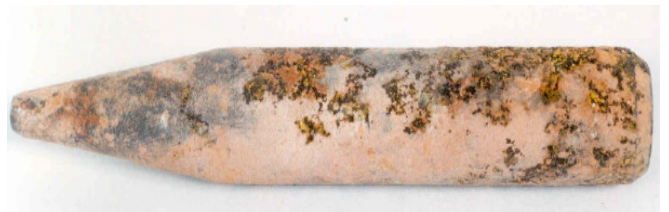
Deze DU-penetrator werd gevonden in de spouw van een muur. Er is een kleine hoeveelheid geelkleurige oppervlakte-oxidatie zichtbaar op de penetrator. Deze oxidatie treedt vlug op bij kamertemperatuur.

Tot op heden werd er geen DU gevonden in nanostofdeeltjes. Wanneer een DU-kogel op een tank inslaat, verdampen de metalen in de tank door de ontstane extreem hoge temperaturen. Zo ontstaan metalische nanodeeltjes. De gevonden nanodeeltjes in de dode weefsels van soldaten en burgers, en, die gevonden in de bodem van de gebieden waar de ziekten werden opgelopen, zijn onderling compatibel.