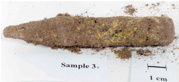
Deze DU-penetrator werd op het grondoppervlak gevonden onder puin en sneeuw. Hij was in ernstige mate gecorrodeerd. De geelkleurige oxidedeeltjes braken ervan af bij aanraking.

Miller, dr. A.C., et al.: Carcinogenic potential of depleted uranium and tungsten alloys ; http://deploymentlink.osd.mil/deployed/Cancer/DoD122.shtml